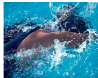
«Gesundheit und Sport»