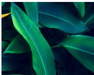
«Natur und Ökologie»