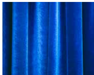
«Kunst und Kultur»