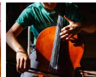
Substiftung «Little Sun»